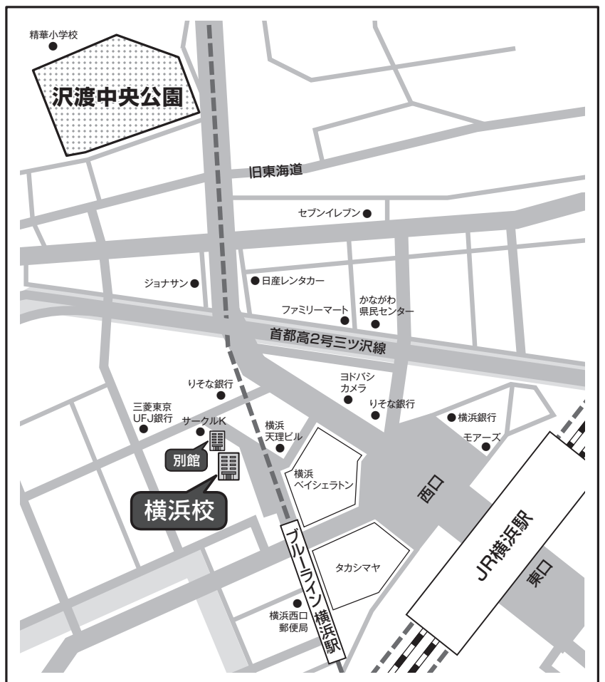
非常時の避難場所：沢渡中央公園