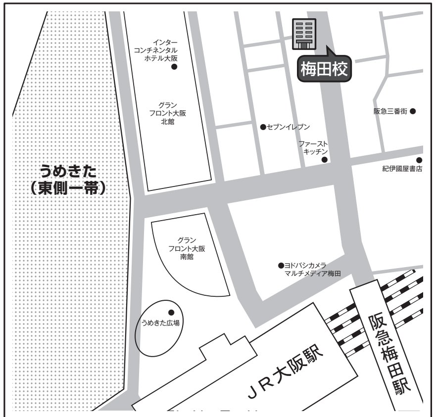
非常時の避難場所：うめきた(東側一帯)