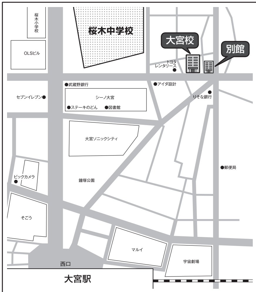
非常時の避難場所：桜木中学校