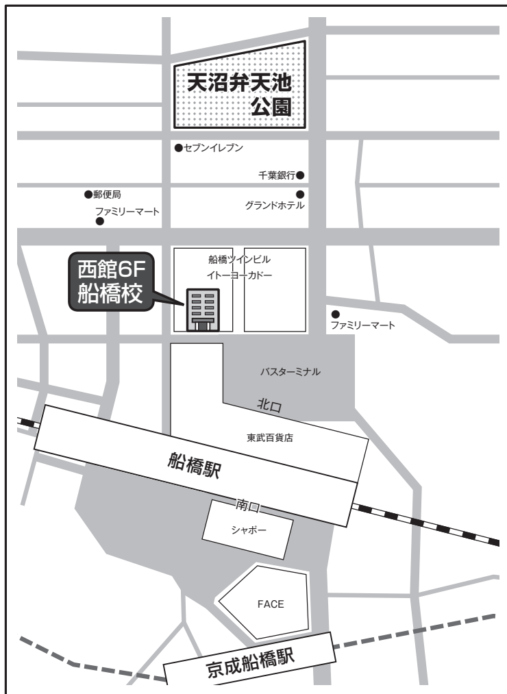
非常時の避難場所：天沼弁天池公園